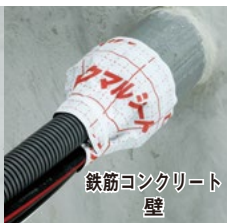
鉄筋コンクリート 壁