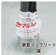
鉄筋コンクリート 床

合成樹脂製可とう電線管とケーブルの混在もOK、再施工も可能です。結束バンドも付属し、これだけで防火措置ができる安価なキット品です。