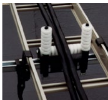
直線用ケーブルローラーの取付例